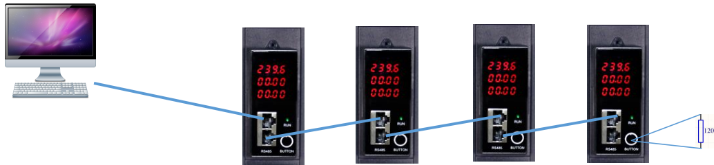
图 1 通信组网拓扑图

本仪表采用 MODBUS-RTU 协议，物理通道采用 RS485 标准，组网的拓扑结构如图 1。